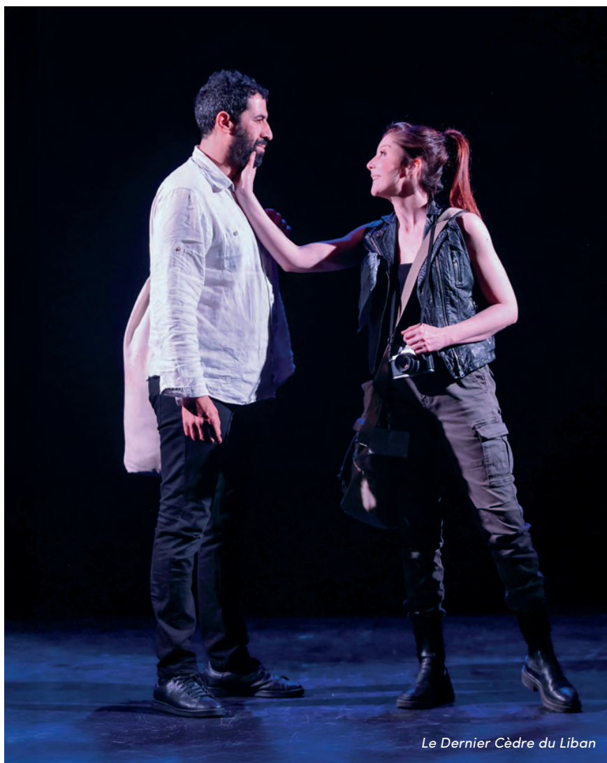
Le Dernier Cèdre du Liban