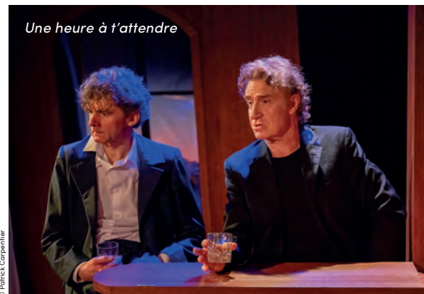
Une heure à t'attendre

Le Dernier Cèdre du Liban , jusqu'au 28 décembre 2025, théâtre de l'Œuvre Une heure à t'attendre , jusqu'au 5 octobre, théâtre de l'Œuvre